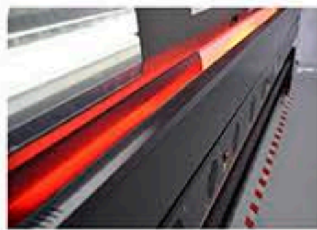
Regulación altura de carro