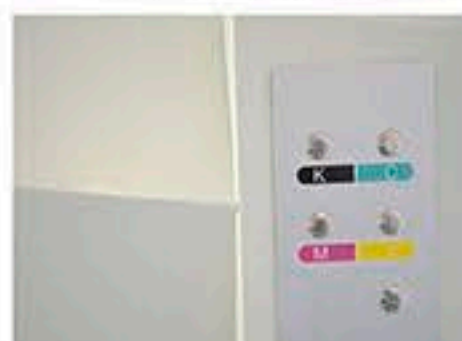
Secado IR alta velocidad