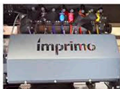
Sistema industrial tintas